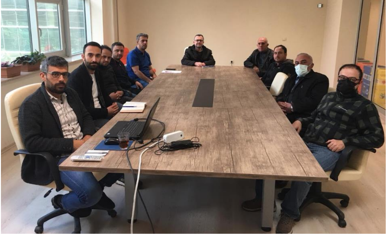
Şekil 5.1 Kalite kurulu, müfredat ve eğitim planı düzenleme toplantısı

2022 yılında yılın farklı dönemlerinde öğrencilerimizin, anabilim dalı hocalarımızın ve iç-dış paydaşlarımızın katılımlarıyla toplantılar yapılmıştır. Bu toplantılarda öğrencilerimizden gelen geri dönüşler ve iç-dış paydaşlarımızın sektördeki ihtiyaçlara yönelik yaptıkları yorumlar ve anabilim dalımız öğretim üyeleri ile yapılan fikir alışverişleri proje ve ortak çalışmalar yapılmış ve sonrasında eğitim planlarında revizyona gidilmiştir. Şekil 4.1’de kalite kurulu, müfredat ve eğitim planı düzenleme toplantısına ait görsel mevcuttur.