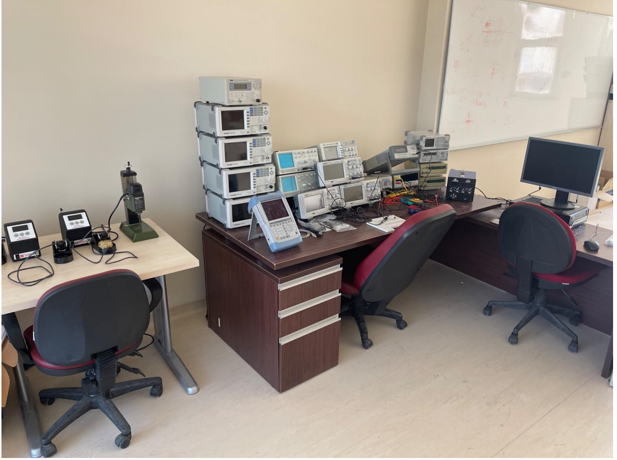
Şekil 8.4. İleri teknolojiler araştırma ve geliştirme laboratuvarı