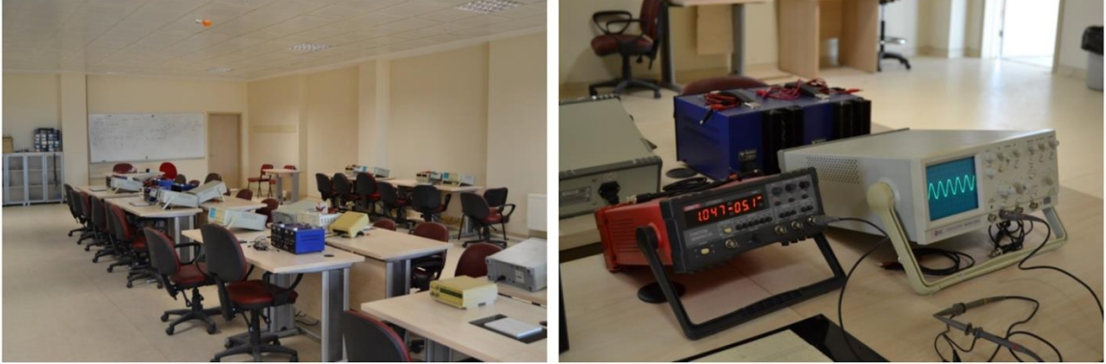
Şekil 8.2. Devre ve Lojik Laboratuvarı

olmadıkları değerlendirilip analizleri yapılır. Şekil 8.2’de Devre ve Lojik Laboratuvarı görseli verilmiştir.