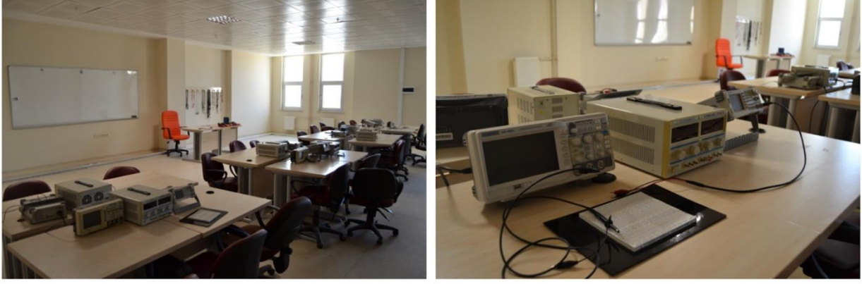
Şekil 8.3. Analog ve dijital elektronik laboratuvarı