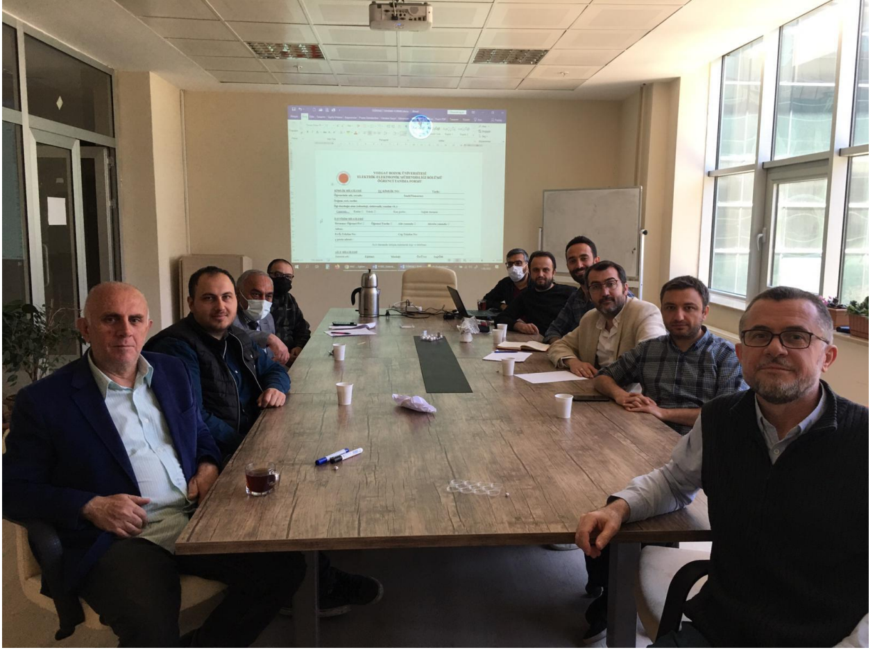
Şekil 3.1. Müdek Komisyon Toplantısı