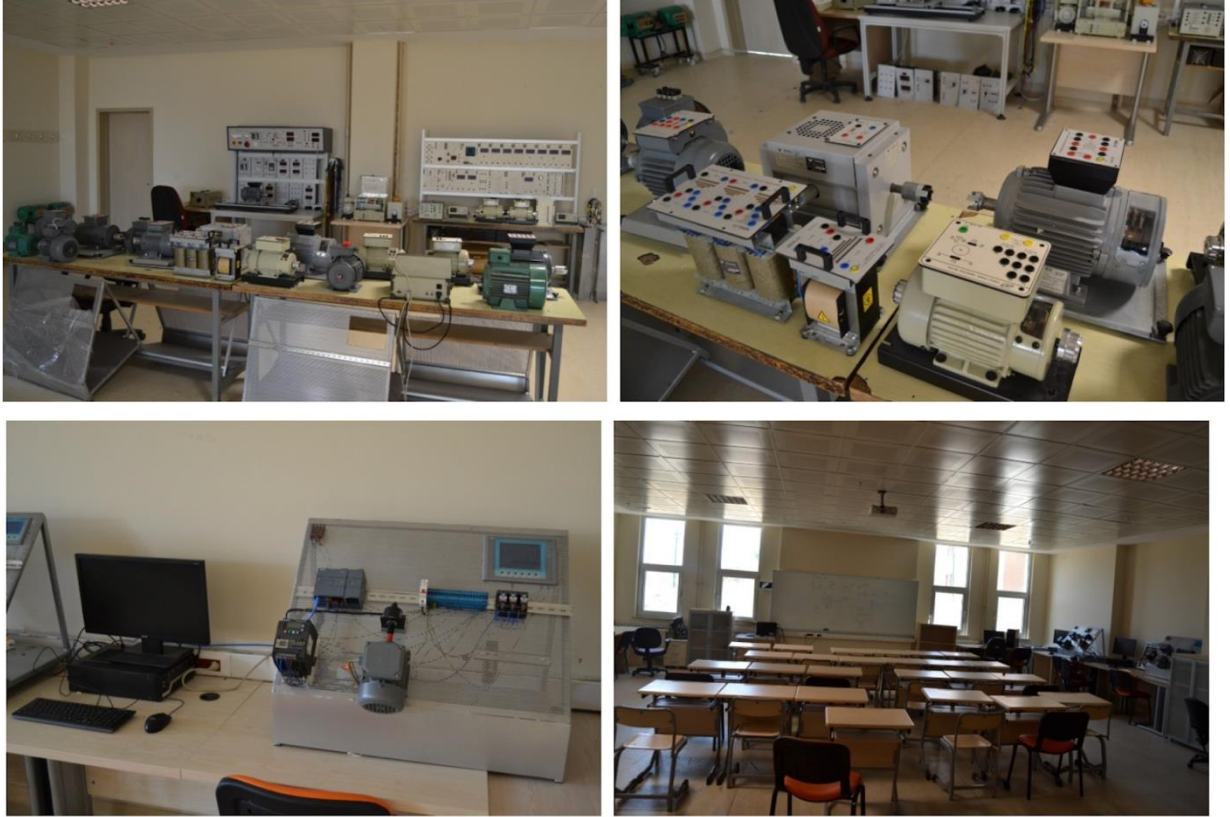
Şekil 8.1. PLC ve Makine Laboratuvarından Görünüm

Bu laboratuvarlarda, normal şartlar altında 16 öğrenci ders görebilmektedir, başlıca PLC kontrol programı TIA portal'ın yüklü olduğu bilgisayarlar ve bu bilgisayarlara bağlı Siemens Simatic S7 model PLC kontrol üniteleri bulunmaktadır. Anahtarlama kontrol test devre kitleri ve ölçüm cihazları olarak ampermetre ve multimetreler bulunmaktadır. Tek fazlı asenkron ve senkron motorlarla birlikte lojik anahtarlama kontrol deney setleri bulunmaktadır. Üç fazlı elektrik motor kontrol devreleri ve motor sürücüleri bulunmaktadır. PLC ile analog işlemler yapılacak şekilde potansiyometrelerle ve rölelerle LED simülasyon ve anahtarlama işlemleri yapılır. Dijital ve analog giriş çıkış uygulamaları gerçekleştirilmektedir. Operatör paneli uygulamaları HMI ile kontrol sağlamanın yanında bilgisayardan doğrudan programlama ve kontrol üzerinden PLC programlama yapabilme imkânı sağlanmakta olup TIA Portal üzerinden başlıca PLC kontrol ve anahtarlama deneyleri yapılmaktadır. Şekil 8.1'de PLC ve Makine Laboratuvarından görünüm verilmiştir.