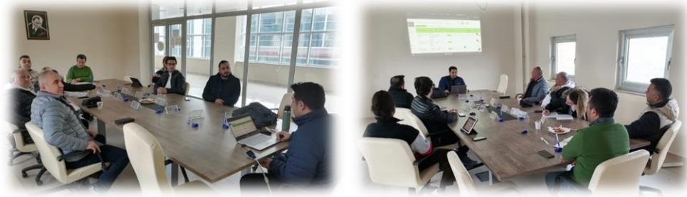
Şekil 2. İç paydaşlarımızla gerçekleştirilen toplantılardan görüntüler

Paydaşların görüş ve önerilerini belirlemek amacıyla toplantılar düzenlenmiştir. Paydaşların görüş ve önerileri doğrultusunda 2022-2026 dönemi stratejik planı hazırlanmasında üniversitemizin, fakültemizin stratejik planlarında yararlanılarak mevcut durumu ve beklentilerinin yansıtılmasına özen gösterilmiştir. İç paydaşların görüşlerinin belirlenmesinde sadece üniversite, fakülte ve bölüm personeline sunduğu fiziki ve sosyal imkânlarla mali haklara ilişkin görüş, öneri ve beklentilerin değil, ürün ve hizmet sunumunun kalitesinin artırılmasına yönelik değerlendirmeler de dikkate alınmıştır. Bu çerçevede iç ve dış paydaşların beklentileri ve görüşleri doğrultusunda kaliteli hizmet sunulması hedeflenmiştir. Stratejik planda bu beklenti ve önerilere uygun amaç ve hedeflere yer verilmiştir.