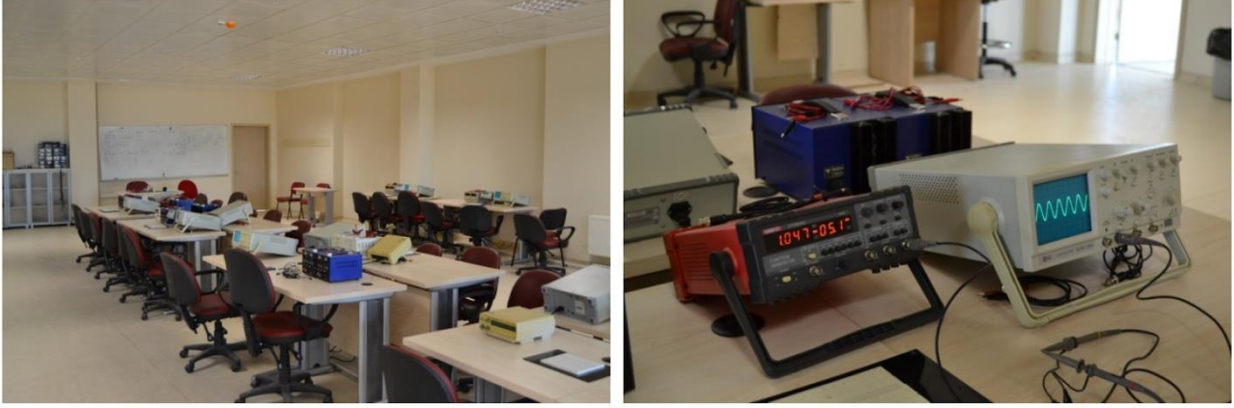
Şekil 8.2. Devre ve Lojik Laboratuvarı