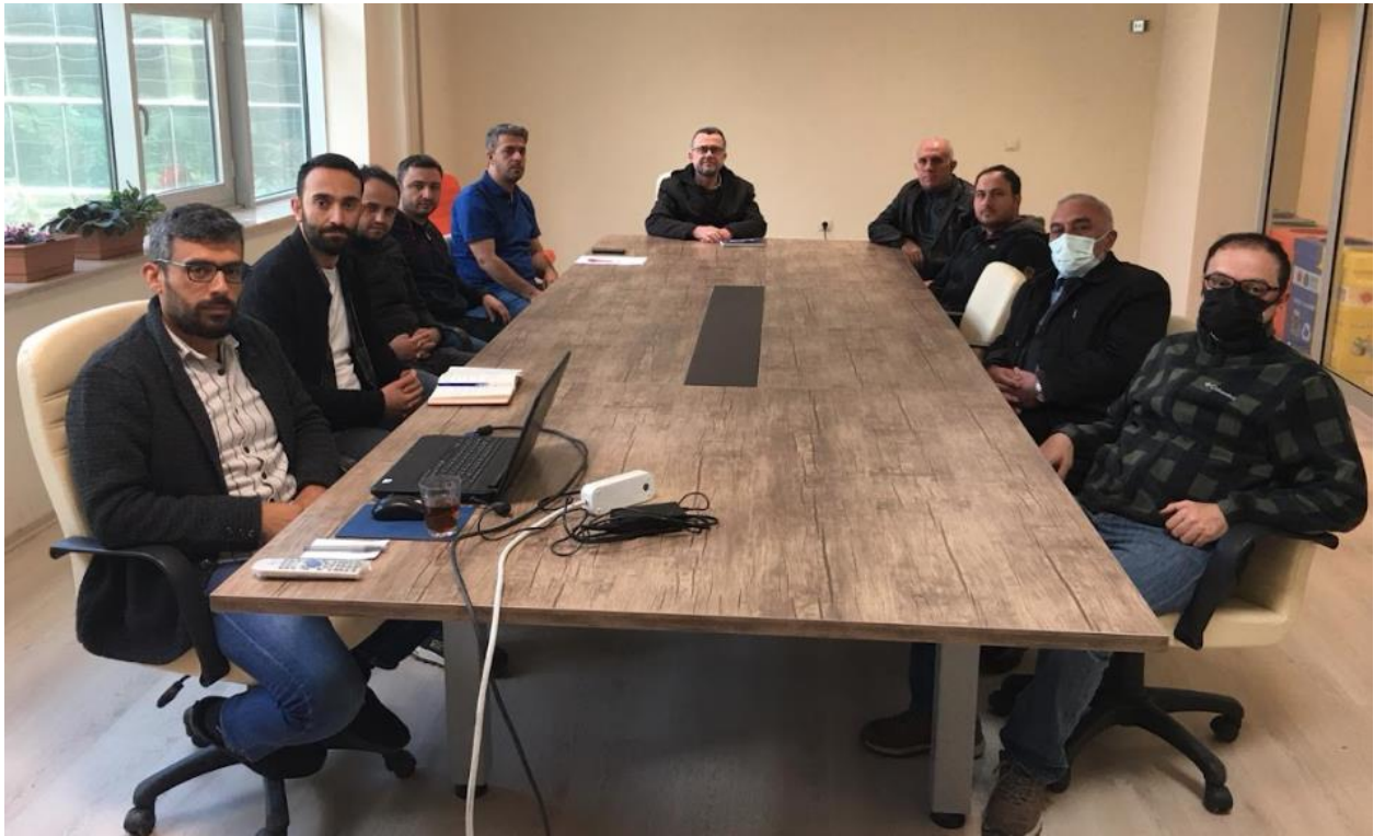
Şekil 5.1. Kalite kurulu, müfredat ve eğitim planı düzenleme toplantısı

2022 yılında yılın farklı dönemlerinde öğrencilerimizin, anabilim dalı hocalarımızın ve iç–dış paydaşlarımızın katılımlarıyla gerçekleşen toplamda 4 adet toplantı yapılmıştır. Bu toplantılarda öğrencilerimizden gelen geri dönüşler ve iç–dış paydaşlarımızın sektördeki ihtiyaçlara yönelik yaptıkları yorumlar ve anabilim dalımız öğretim üyeleri ile yapılan fikir alışverişleri proje ve ortak çalışmalar yapılmış ve sonrasında eğitim planlarında revizyona gidilmiştir. Örnek olarak, Şekil 5.1’de görüldüğü üzere Anabilim dalımızda kalite kurulu, müfredat ve eğitim planı düzenleme toplantısı gerçekleşmiştir.