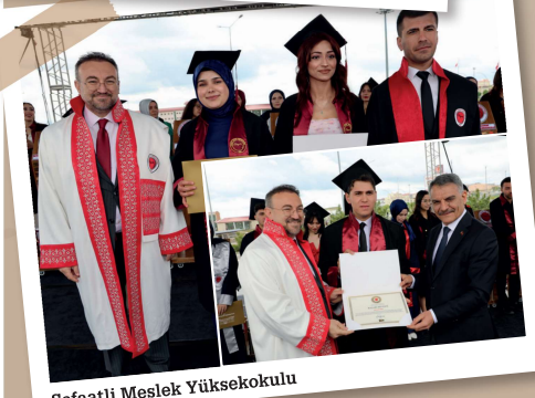
Şefaati Meslek Yüksekokulu