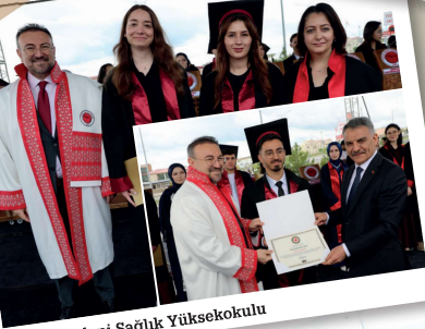
Akdağmadeni Sağlık Yüksekokulu