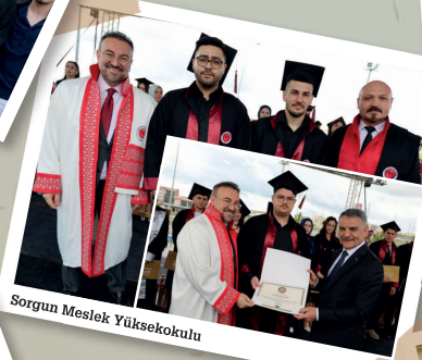
Sorgun Meslek Yüksekokulu