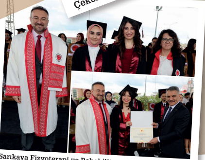
Sankaya Fizyoterapi ve Rehabilitasyon Yüksekokulu