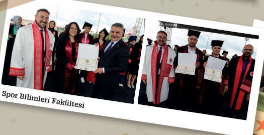
Spor Bilimleri Fakültesi