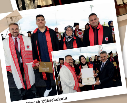
Yozgat Meslek Yüksekokulu