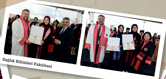
Sağlık Bilimleri Fakültesi