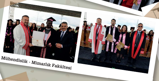
Mühendislik - Mimarlık Fakültesi