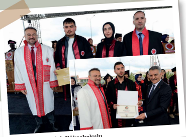
Boğazlıyan Meslek Yüksekokulu