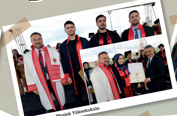
Akdağmadeni Meslek Yüksekokulu