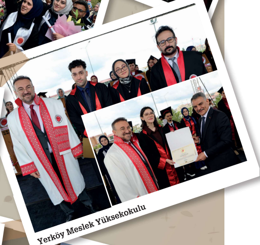
Yerköy Meslek Yüksekokulu