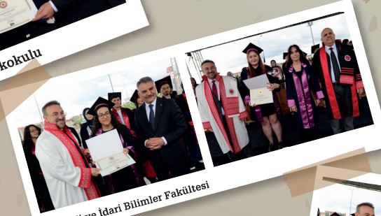
İktisadi ve İdari Bilimler Fakültesi