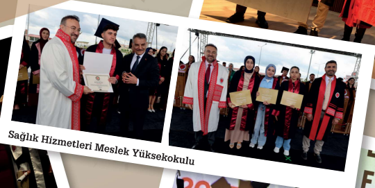
Sağlık Hizmetleri Meslek Yüksekokulu