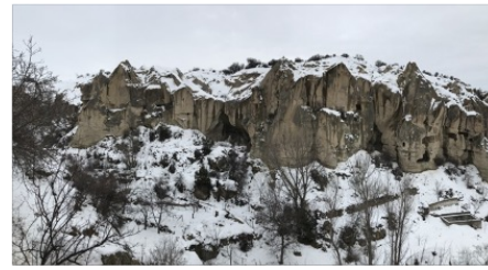
Göreme Vadisinden bir görünüm, Nevşehir / A view from the Valley of Göreme, Nevşehir