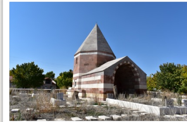
Şah Sultan Türbesi, Çandır, Yozgat / The tomb of Şah Sultan, the district of Çandır, Yozgat