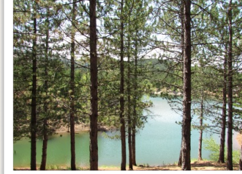
Yozgat Çamlık Milli Parkı ve göletinden bir görünüm / Yozgat Pinetum