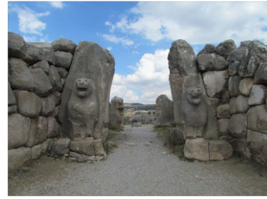
Hattusha'dan bir görünüm, Çorum / A view from the Hittite site of Hattusha, Çorum