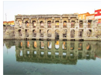
Sarıkaya Roma Hamamı, Yozgat / The Roman Bath in the district of Sarıkaya, Yozgat