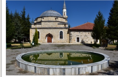
Emirci Sultan Türbesi, Osmanpaşa Köyü, Yozgat / The tomb of Emirci Sultan, the village of Osmanpaşa,