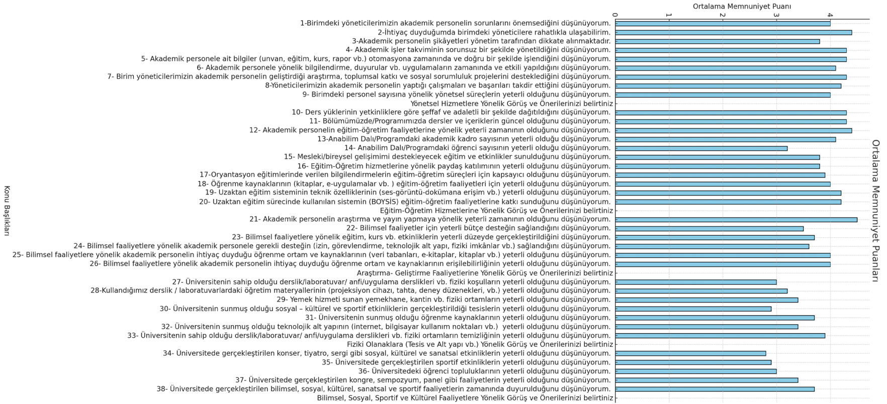
Şekil 1. Akademik personel ortalama memnuniyet düzeyleri